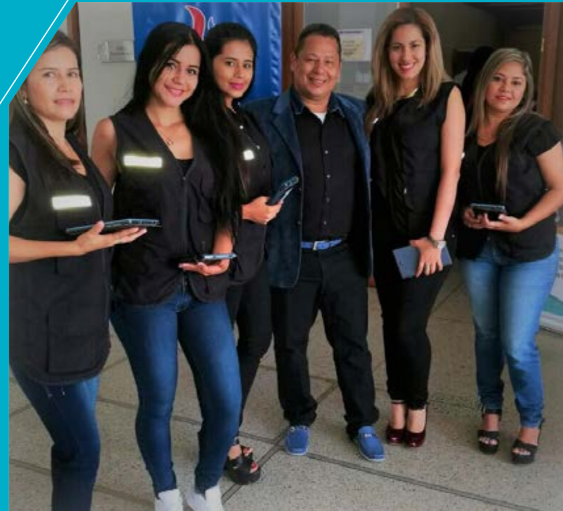
Equipo de Trabajo